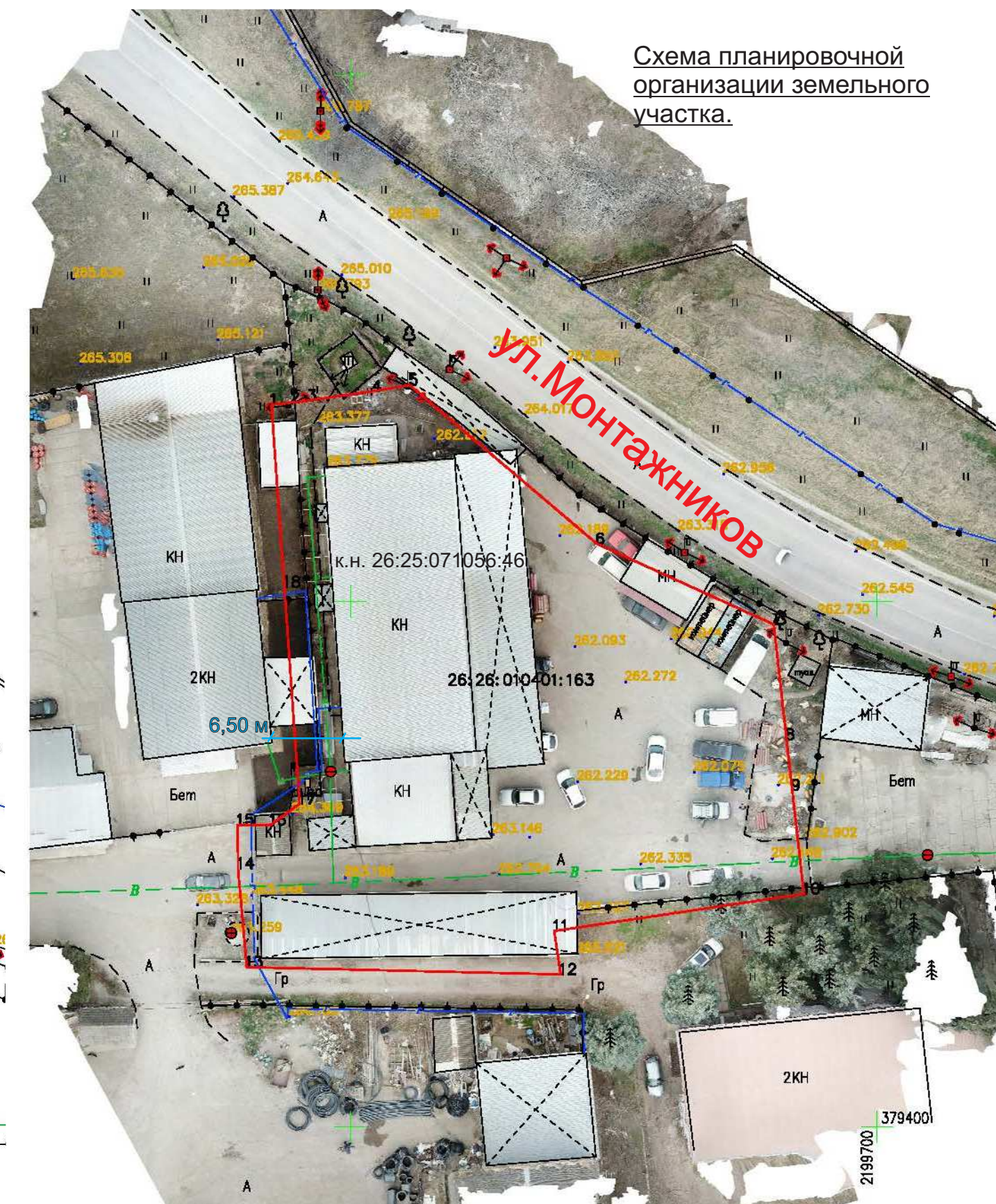
Схема планировочной организации земельного участка.

Земельный участок с к.н. 26:26:010401:163 расположен в зоне “ПД”- зона производственной деятельности