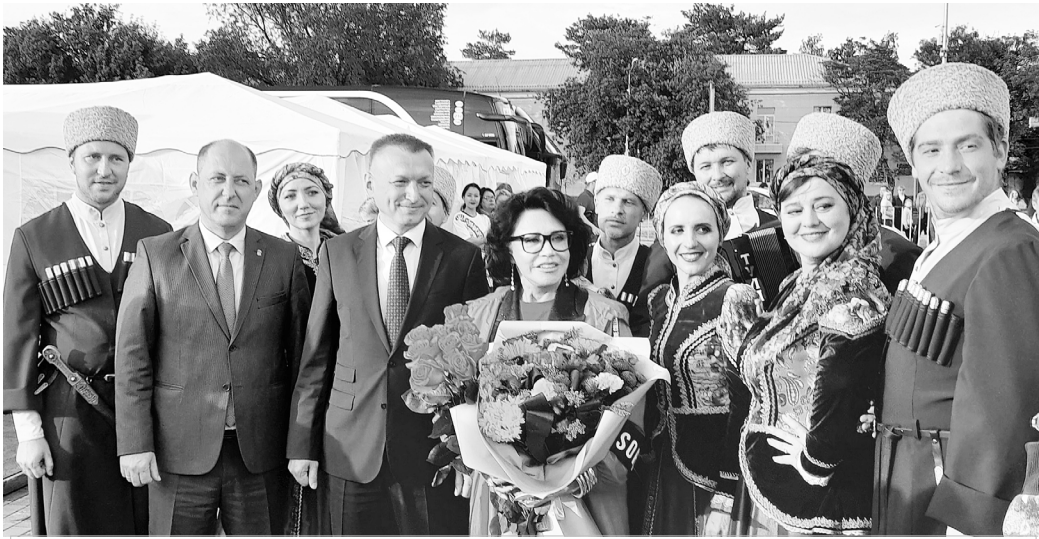
15-ый фестиваль «Песни России» в Георгиевске

Когда заканчивались последние приготовления, народ заполнял главную площадь округа.