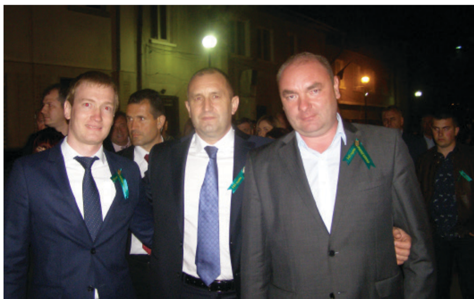
на фото: делегация города Георгиевска и президент Болгарии Румен Радев