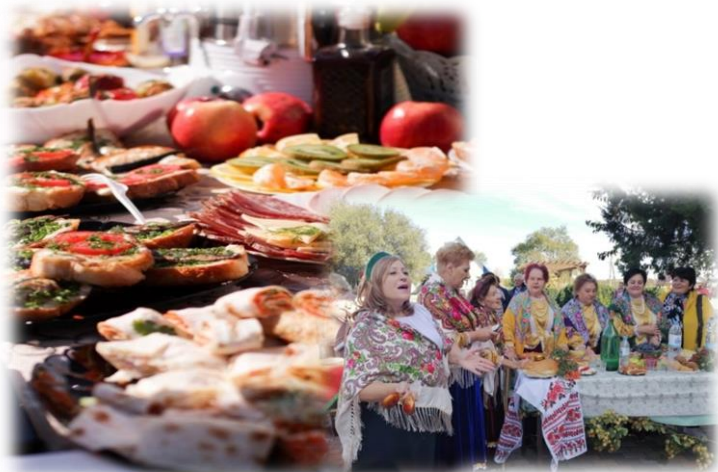
Гастрономический тур по Георгиевскому муниципальному округу