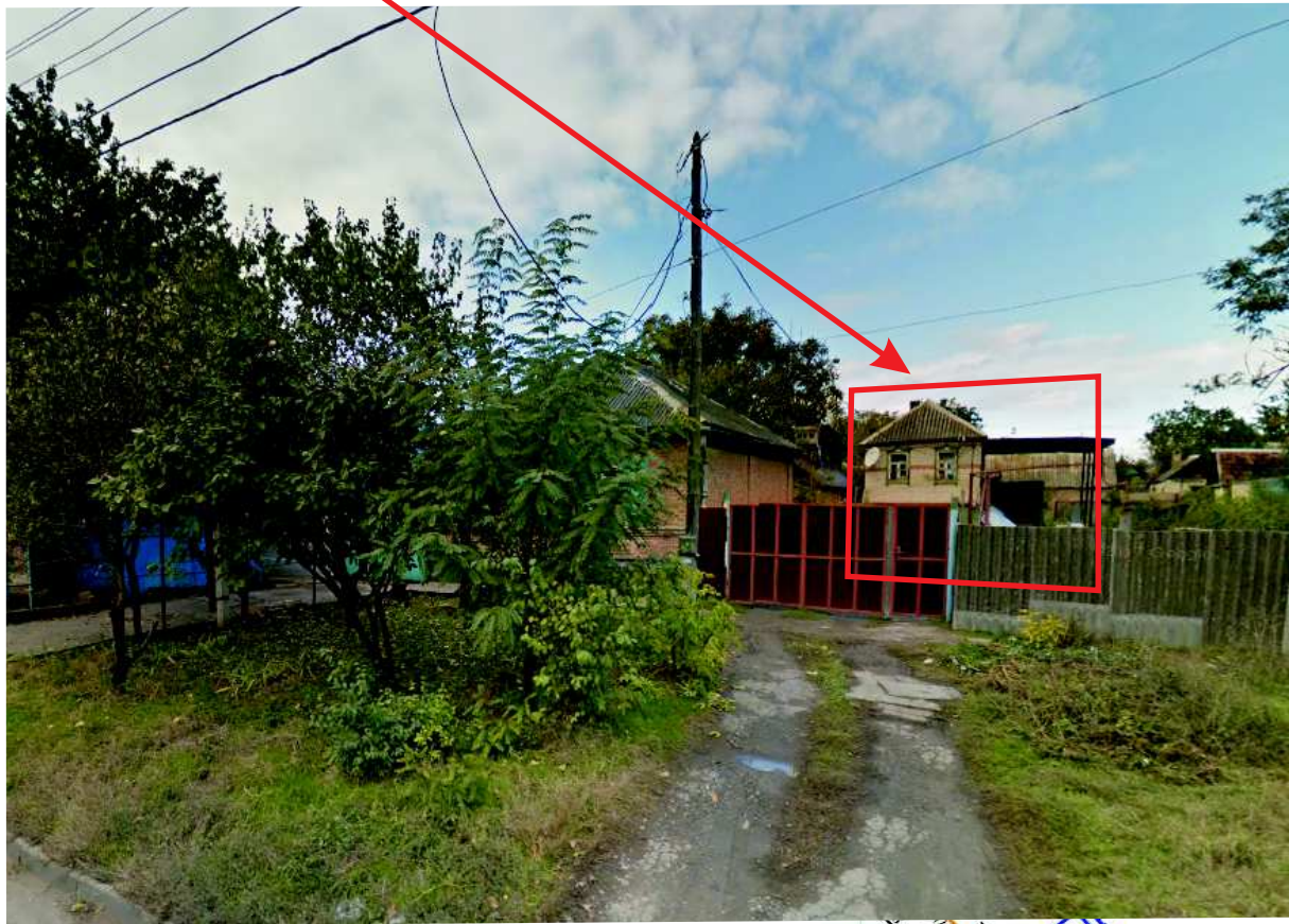
Место предполагаемого строительства