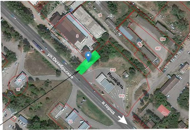
З/уч.с к.н. 26:26:010201:915 расположен в зоне ПД