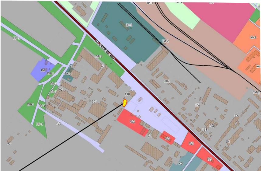
Зем/уч с к.н. 26:26:010202:427 расположен в зоне “ПД” - зоне производственной деятельности.