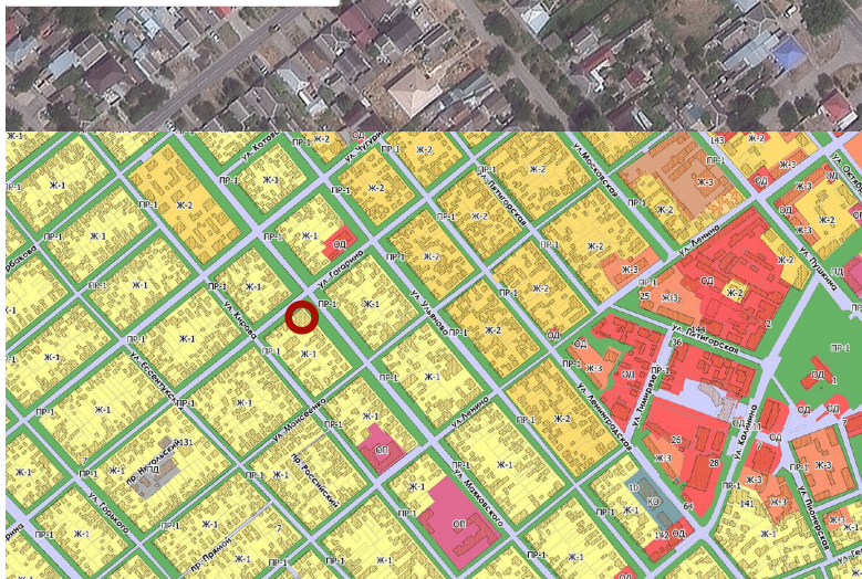
СХЕМА РАЗМЕЩЕНИЯ ОБЪЕКТА НА ЗЕМЕЛЬНОМ УЧАСТКЕ М 1:1000