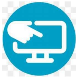
Телевизоры SMART TV