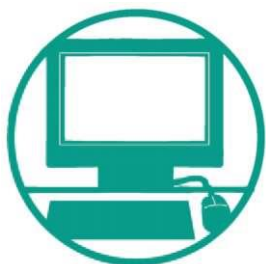
мобильные компьютерные классы

В общеобразовательные учреждения поставлено современное компьютерное оборудование: