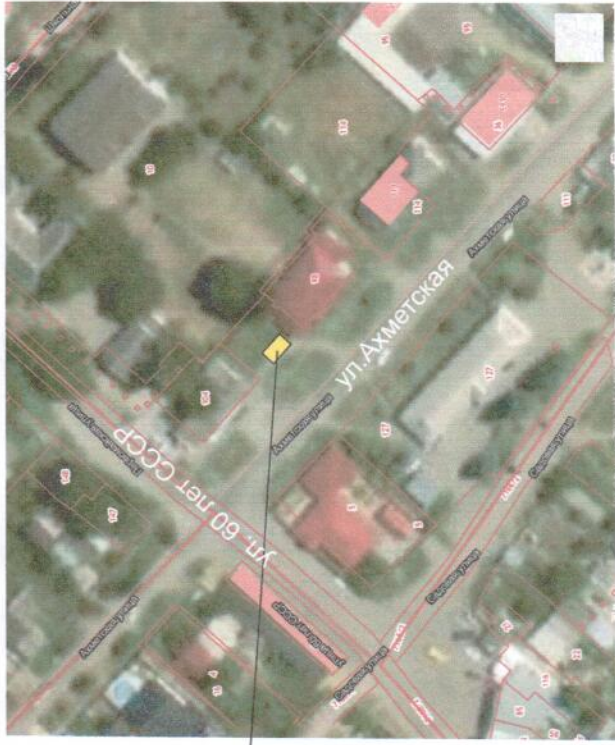
место размещения павильона

Нестационарный торговый объект - павильон , площадью 30,00 м2, размером 6,00 м x 5,00 м расположен в створе с главным фасадом и в 7,00 м от створа бокового фасада нежилого здания по ул.Ахметской, 14.