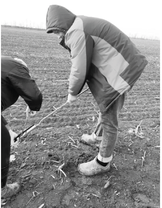
Управление сельского хозяйства администрации Георгиевского городского округа

На полях округа постоянно ведется мониторинг содержания влаги в метровом слое почвы. 4 марта 2023 года будет проведен второй отбор образцов по 5 реперным участкам. По итогам первого отбора отмечается недостаток запасов влаги в метровом слое. Если на глубине до 60-70 см влага есть, то в слое 90-100 см она, за последние 2 года, не накопилась.