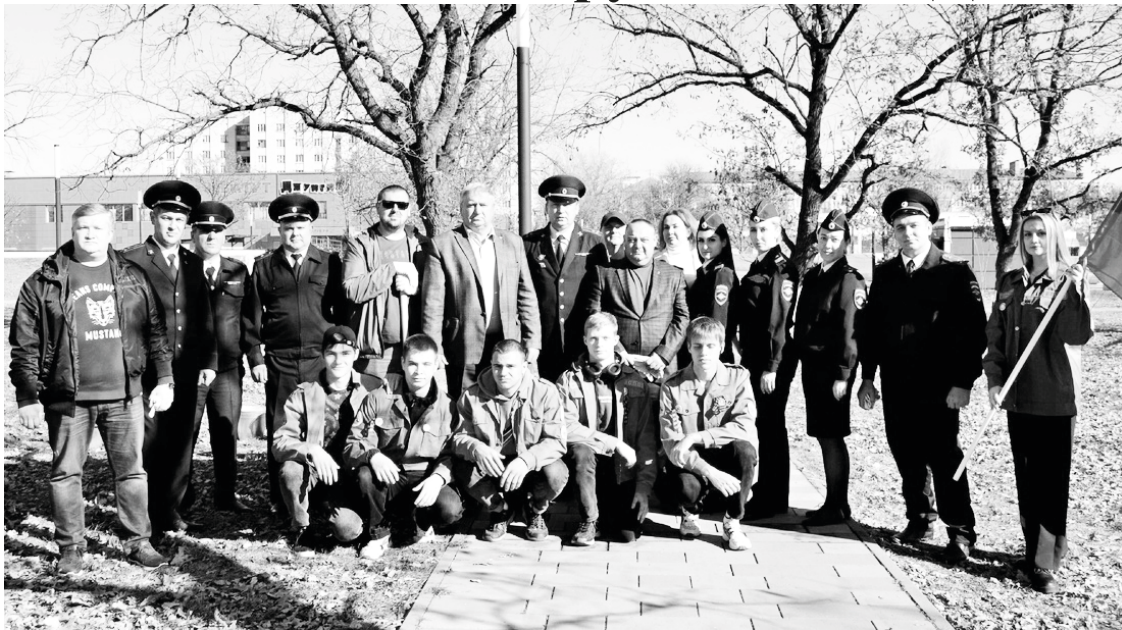
50 саженцев лип и катальп в память о погибших стражах порядка высадили в Георгиевске в парке Дружбы и по улице Калинина.